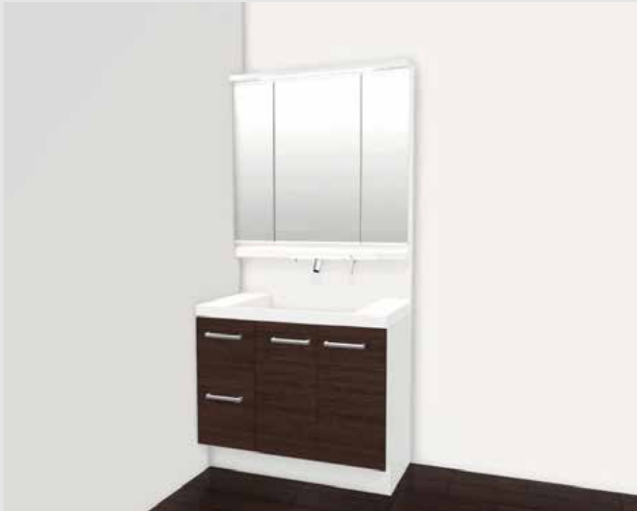
08合成によるイメージ画像です。