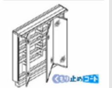
5面鏡(全収納・スリムLED) MVJ1-903TXJU