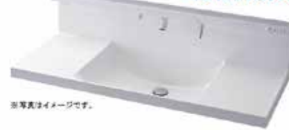
※写真がイメージです。