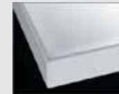
H ブレン材ホワイト