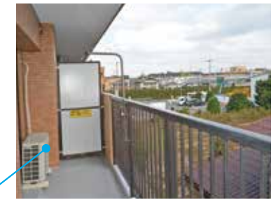
バルコニー 周辺に高い建物も無く 開放感のある眺望。