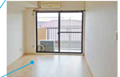
LDK 電気をつけなくても明るいリビング。