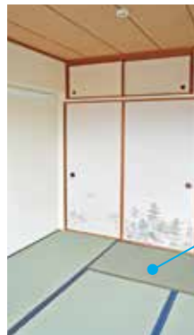
和室 畳もふすまもキレイです。