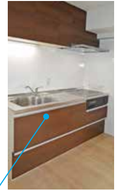
キッチン 手元灯はセンサー スイッチで便利です。