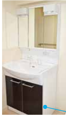
洗面 三面鏡の内側も収納 になっています。