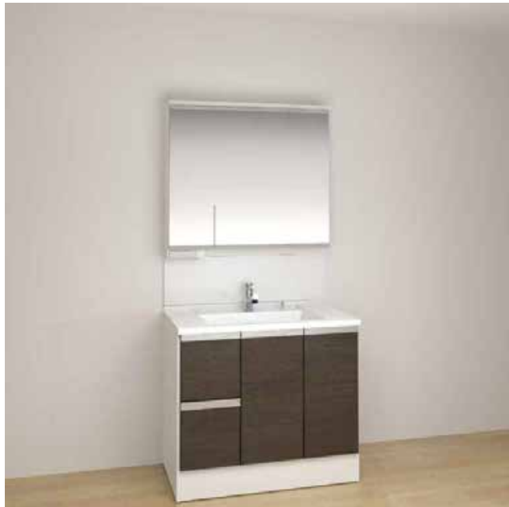
※画像はイメージです。組合せなどはお見積書をご確認ください。