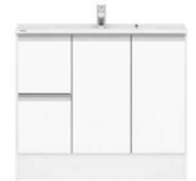
引出しタイプ (画像は幅900サイズ)