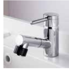
マルチシングルレバーシャワー レバー1つで調節。