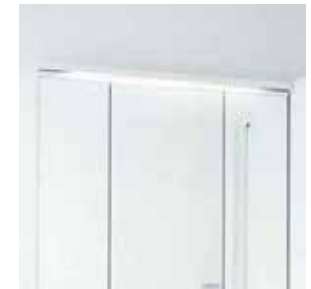
薄型のLED照明で空間すっきり。 省エネ・長寿命を実現してい ます。点灯幅は685mm。