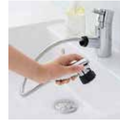
吐水口部分を引き出せば ボール掃除もラクラクです。