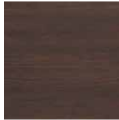
ソフトウォールナット柄