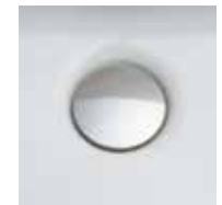
掃除しにくいフチの 隙間がない排水口。