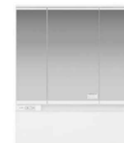
3面鏡 LED照明 ミドルパネル