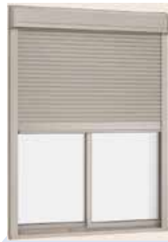
※1F:掃出しシャッターは1F用電動・アシスト仕様