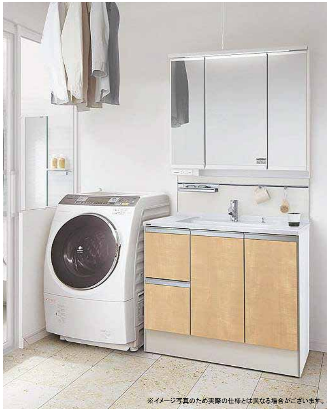
※イメージ写真のため実際の仕様とは異なる場合がございます。