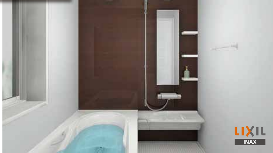
※CG合成によるイメージ画像です。

SYSTEM BATHROOM Arise 1616サイズ BMD5-1616LBZ+H